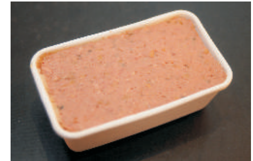
Wildterrine Formen zu ca. 260 g