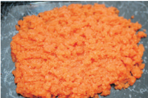
Rauchlachs Tartar, 250 g