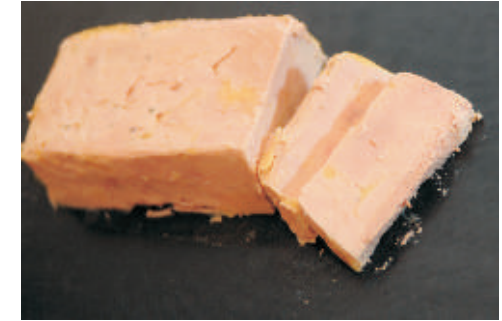
Gänseleberterrine Formen zu 180 g