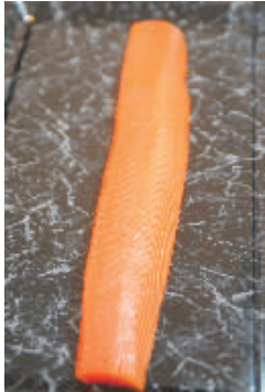
Rauchlachs Rückenfilet, ca. 500 g