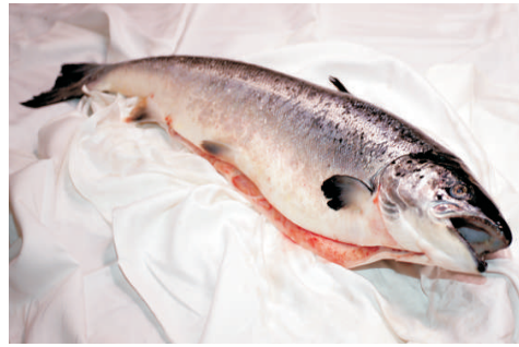
Frisch Lachs Nur auf Bestellung