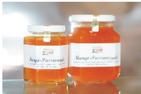
Verschiedene haus- gemachte Konfitüren