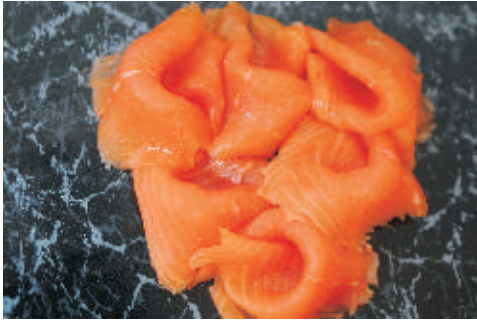
Rauchlachs geschnitten oder am Stück