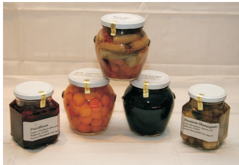
Preiselbeeren, marinierte Champignons, Essizwetschgen