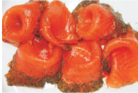
Gravedlachs geschnitten oder am Stück