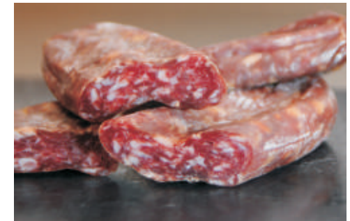
Hirschsalsiz paarweise verpackt